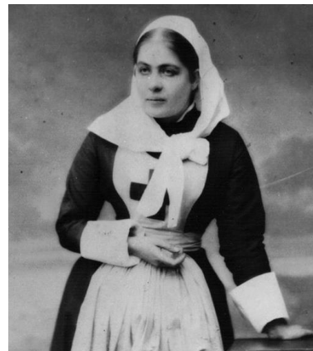
Баронесса Юлия Вревская

Крымская война и ее первые сестры милосердия показали всему миру, сколь актуально именно женское участие в положении раненых. Женские по-особому нежные руки причиняли меньше страданий, женское чуткое сердце угадывало малейшее пожелание солдат, ставших вдруг совершенно беспомощными. На эти преимущества сестер милосердия (и в окопах, и в госпиталях, и позднее в поездах), по сравнению с дюжими санитарями, многие очевидцы обращали внимание в официальных докладах и личных воспоминаниях. Тот же знаменитый Пирогов писал о первых сестрах Крымской войны: «Горжусь тем, что руководил их благословенной деятельностью».