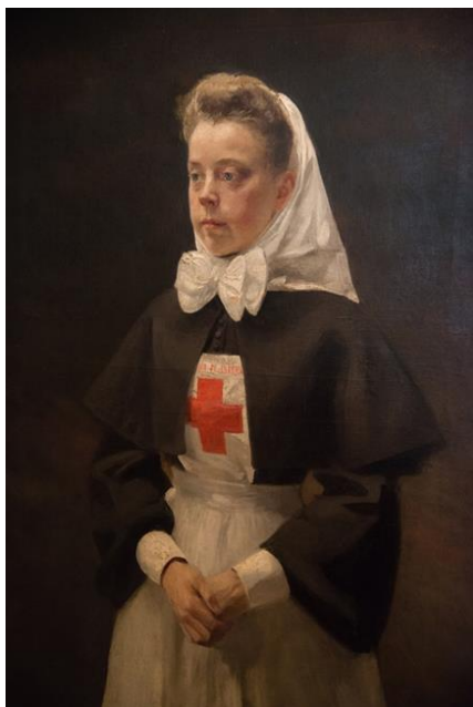
Княгиня Наталья Шаховская