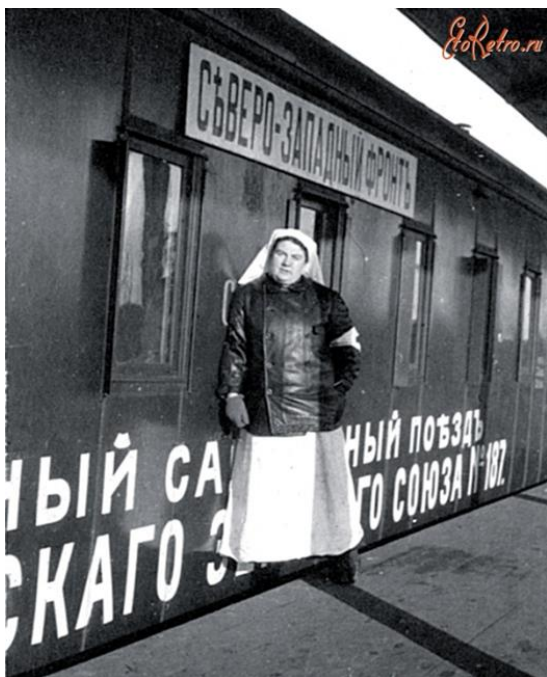
Александра Львовна Толстая