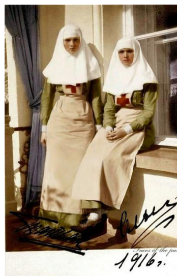
Дочери Николая II