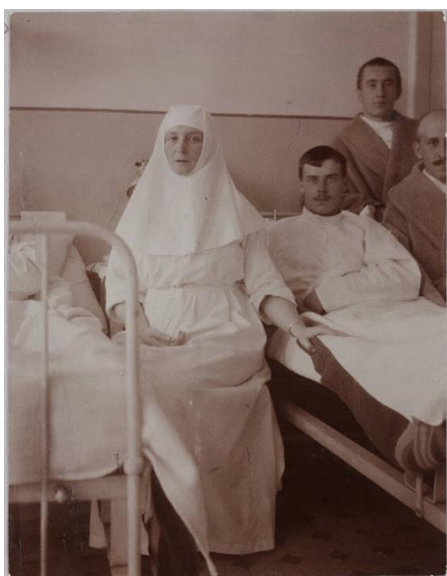
Императрица Александра Федоровна в госпитале

Императрица Александра Федоровна, супруга последнего императора Николая II и его дочери в годы Первой мировой войны ухаживали в лазаретах за тяжелооболными. Фрейлина Анна Вырубцова, также прошедшая курсы сестер милосердия писала: «Я видела Императрицу России в операционной госпиталю: то она держала вату с эфиром, то подавала стерильные инструменты хирургу. Она была неутомима и делала свою работу со смирением, как все те, кто посвятил свою жизнь служению Богу.